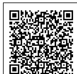
相談フォーム QR コード

https://forms.office.com/Pages/ResponsePage.aspx?id=nohog3i8oUCnhWw5LBJ5dqFAysK_C_NOmNsq6DxuvktUNEpOTFJHS0tSTkFHRUIXSIhSM0dKN1RCRy4u